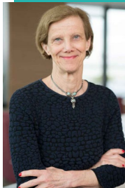
Pr Anne-Claude Crémieux