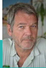
Pr Pierre Cochat